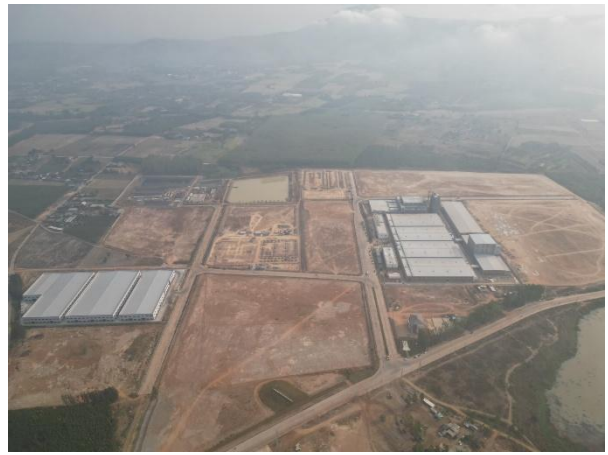
พื้นที่ Zone A