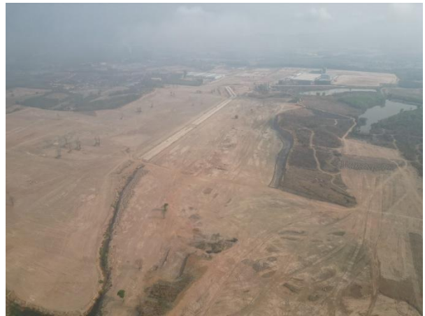
พื้นที่ Zone B